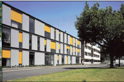
ESTORES DE FACHADAS