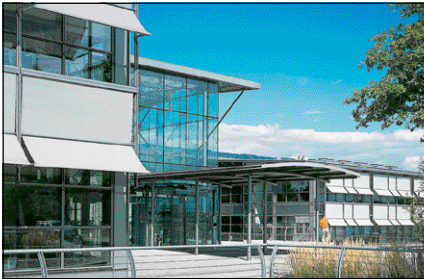
ESTORES DE PROYECCIÓN